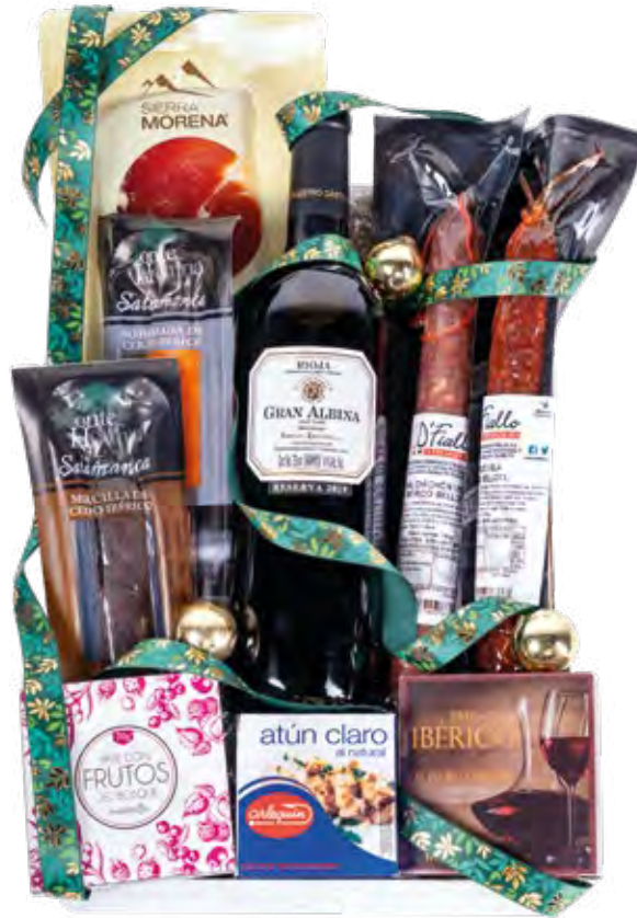
Estuche 706 22,61 € + I.V.A.