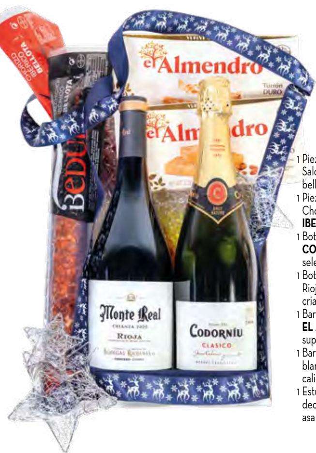
Estuche 707 24,43 € + I.V.A.