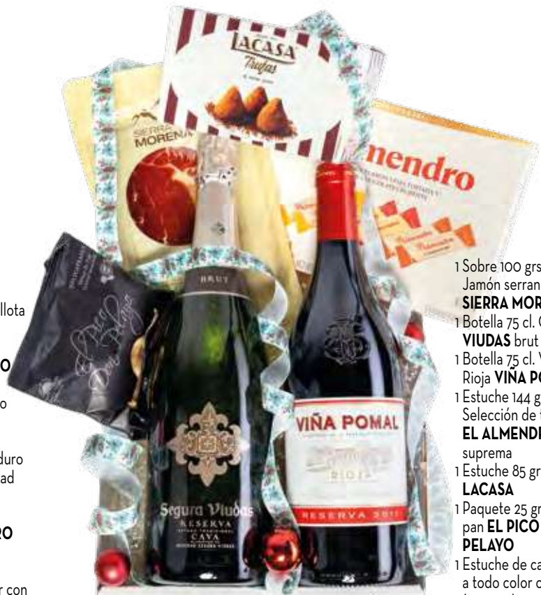
Estuche 708 26,15 € + I.V.A.