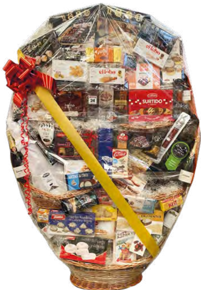
Muestra únicamente de presentación de la Cesta XXL, no de productos